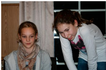
KonfirmandInnen-Zeit: Spiel-Räume des Glaubens entdecken und ausprobieren (Szene während der ersten Wochenendfreizeit)

Ich glaube an Jesus Christus, der meinen Weg kennt und die Wege aller Menschen, der mich da abholt, wo ich stehe, und nicht auf sich warten lässt, zu dem ich immer kommen kann, wann ich will, und der mich nicht einengt, der mich nimmt, wie ich